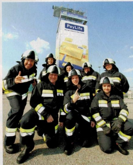
Das mutige Team der SCS Betriebsfeuerwehr inklusive Center Management und Technik

Der Start des Spider Rock XL Turms liegt in schwindelerregender Höhe von 36 Metern.